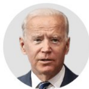
Joseph R. Biden Jr.