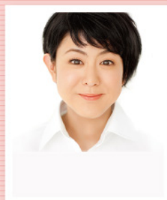
福田 えり子氏 (前衆議院議員)